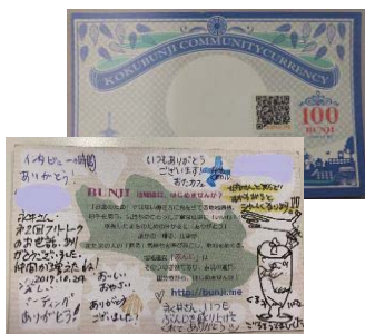
地域通貨「ぶんじ」。裏面にはたくさんのメッセージが...

理念が先に立つと、人間関係さえそのための手段になりかねません。目の前の人との関係を大事にし、一人一人ができることを持ち寄って、それが自然とつながっていくのが「地域通貨ぶんじプロジェクト」の実践なのではないかと思っています。