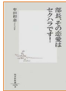
『部長、その恋愛はセクハラです！』 牟田和恵 集英社 2013年