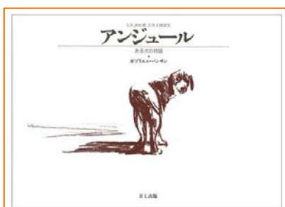
『アンジュール ある犬の物語』 ガブリエルバンサン ブックローン社 1986年

突然、車の窓から投げ捨てられた犬。走り去る車を追って疾走するが、やがて車は視界から消えてしまう。途方に暮れ、うなだれて歩き続ける犬の姿はあまりに哀しい。ペットの犬と捨て犬、同じ犬でも立場が変わると人間からの視線や扱いも変わってしまうという現実。犬の思いが痛いほど伝わってくる。鉛筆デッサンだけの絵本の原点。