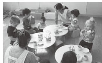
みんなで食べるおやつ

友達のまねをしたり、一緒に楽しく遊んだり、時にはおもちゃを取り合ったりする中で、子どもたちはかけがえのない体験を重ねます。保育者は仲間の中で子どもが育つよう、公平で適切な言葉をかけるように努めています。また、随時保護者との話し合いを持ち、安心して通ってもらえるよう心がけています。小さいお子さんがいる外国の方、ぜひ生活日本語教室へお越しください。