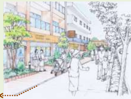
壁面後退により前面空間を創出して緑を配置した場合のイメージ まちなみのイメージ

緑豊かな本エリアの特性を将来も維持するため、民有空間及び公共空間の緑化を進めるとともに、市の貴重な歴史資源である史跡との調和を図り、住みやすい住宅環境のまちを目指します。