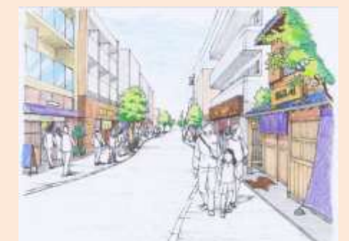
まちなみのイメージ

また、駅に近いエリアを中心に、建築物の低層階に店舗等が続き、人が集まり、人を呼ぶ、にぎわいのあるまちを目指します。