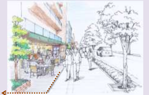
壁面後退によるオープンスペースを創出した場合のイメージ まちなみのイメージ

中高層建築物の立地を誘導し、特に、駅に近い北側のエリアでは、低層階に店舗等があり学生や住民が集い楽しむことのできるまちを目指します。