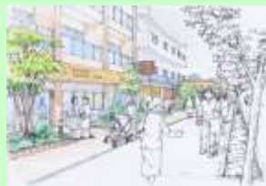
壁面後退により前面空間を創出して緑を配置した場合のイメージ

緑豊かな本エリアの特性を将来も維持するため、民有空間及び公共空間の緑化を進めるとともに、市の貴重な歴史資源である史跡との調和を図り、住みやすい住宅環境のまちを目指します。