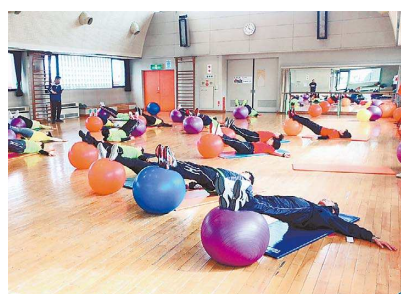
▲バランスボールで実技研修