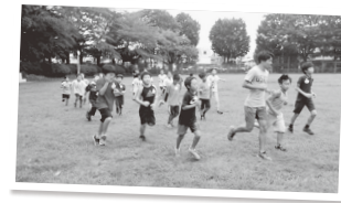
▲走り方教室(夏休み)