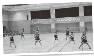
▲月曜チアダンス(市民体操祭)