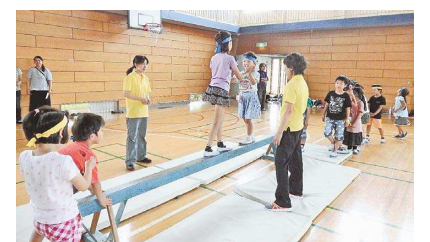
▲楽しみながら平衡感覚を養う、平均台の上での「どんじゃんけん」(第二小学校放課後子どもプラン)