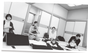
▲ベビーマッサージとストレッチ