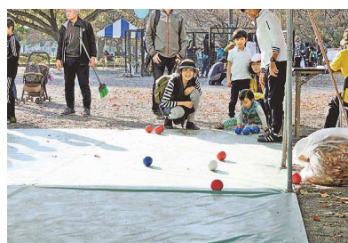
▲秋のスポーツイベントの1ブースとして実施したボッチャ