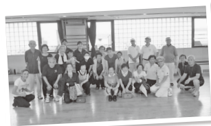
▲60歳からの健康づくり教室

詳しくは、こくぶんじ地域クラブのブログをご覧ください。お気軽にお問い合わせください。(事務局 ☎(090)9824-0401)