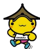
▶第1回フィジカルウォーキング