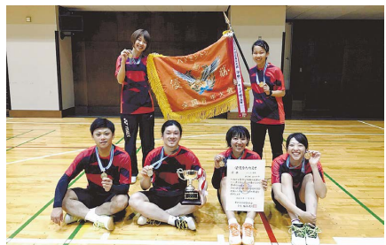
11月10日、第67回全国青年大会バドミントンで市バドミントン協会6人の代表チームが優勝しました。同チームは9月1日に開催された都予選で優勝し、都代表として同大会へ出場しました。