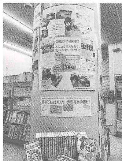
◀並木図書館内コラボ展示

並木図書館と第五中学校とのコラボ第3弾として、絵本のPOPコンテストを行います。第五中学校図書委員会の生徒が「並木図書館のおすすめ絵本」11冊の紹介POPを作成してくれました。POPは絵本とともに並木図書館に展示します。並木図書館に来館された方に投票いただき、POP大賞を決定します。POP展示と投票は12月下旬～1月上旬を予定しています。趣味趣好を凝らしたさまざまなPOPが並びます。ご覧いただくだけでも楽しめます。ぜひ投票にもご参加ください。