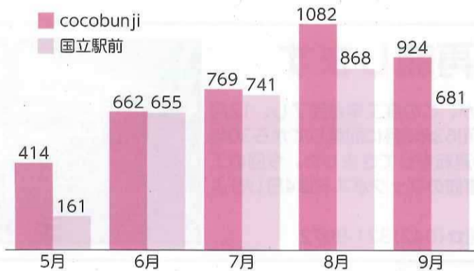
市民サービスコーナー貸出冊数 (H30.5月～9月) ※国立駅前5月14日から