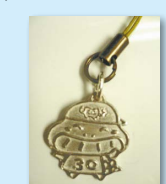
カメ(噛め)ちゃんストラップ

【定】12人【申】5月16日(木)午前9時から電話で健康推進課へ※先着順 ¥無料 催市歯科医師会 (*) 酸を中和して中性に戻す力。 口の中が酸性に傾いているとむし歯になりやすい