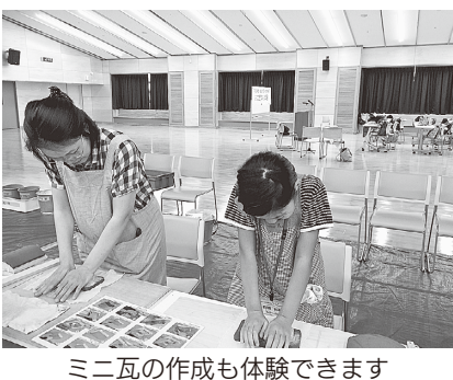
ミニ瓦の作成も体験できます

7月27日(土)午前7時30分〜午後5時30分 埼玉県比企郡鳩山町 バスで行く 市外文化財めぐり