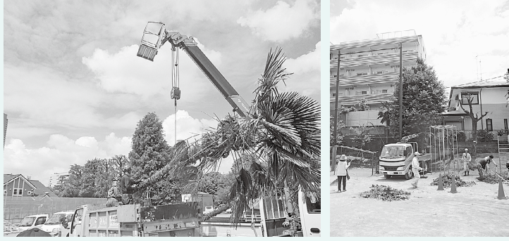
専門的な技術や機材で手入れをしていただきました

市造園組合では、地域の緑化保全のため、市内の小・中学校で 毎年ボランティア活動を実施しています。今年は、6月3日に七 小校庭の樹木の手入れをしていただき、より明るく快適な校庭に なりました。