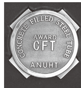
CFT構造賞の記念メダル