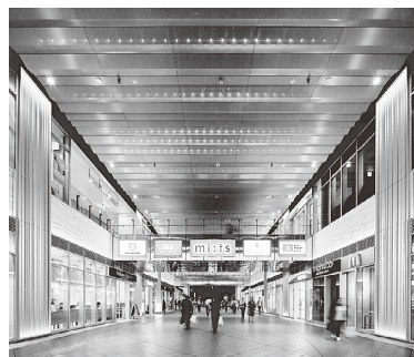
無柱空間を実現した立体通路(南側から)

cocobunji WESTは、国分寺駅と交通広場をつなぐ幅員約12mの立体通路を持つ複合用途の超高層ビルです。CFT構造を採用することで、立体通路の柱を無くし、広がりのある自由な空間を実現し、高い利便性や視認性を確保したことが、今回の受賞につながりました。