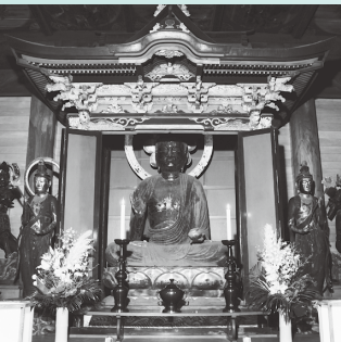
木造薬師如来坐像