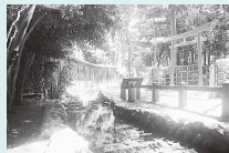
お鷹の道・真姿の池湧水群