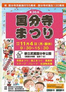
ポスターは自由にお持ちください