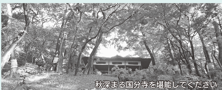
秋深まる国分寺を堪能してください

主な見学場所 殿ヶ谷戸庭園、お鷹の道、真姿の池、おたかの道湧水園(旧本多家住宅長屋門・武蔵国分寺跡資料館)、史跡武蔵国分寺跡(僧寺金堂跡・講堂跡) 定30人 ¥150円(65歳以上は70円) ※殿ヶ谷戸庭園入園料 11月22日(金)までに往復はがき(必着)に住所・参加者全員の氏名(ふりがな)・年齢・電話番号、返信宛名を明記し〒185-0021南町2-16殿ヶ谷戸庭園サービスセンター殿ヶ谷戸庭園・武蔵国分寺跡散策ツアー係へ※多数の場合抽選。1枚のはがきが2人まで申し込み可。小学生以下は保護者同伴 飲み物 問殿ヶ谷戸庭園サービスセンター☎(042)324-7991 動きやすい服装・靴で参加