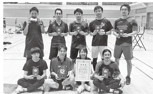
8月4日開催のバドミントン競技男子の部で市バドミントン協会男子が3位に入賞しました。