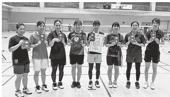
8月4日開催のバドミントン競技女子の部で市バドミントン協会女子が準優勝しました。