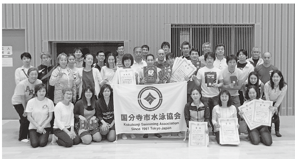
7月14日開催の水泳競技女子の部で市水泳協会女子が準優勝しました。