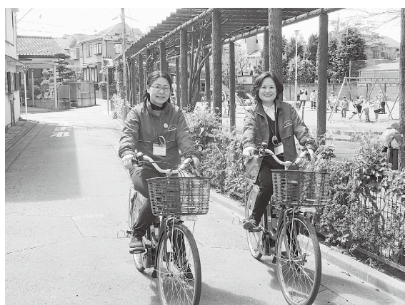
気軽に地域福祉コーディネーターへ相談してください

地域福祉コーディネーター(*)と一緒に地域づくりの基本を学び、自分たちのまちを自分たちでつくるはじめての一步を踏み出してみませんか。