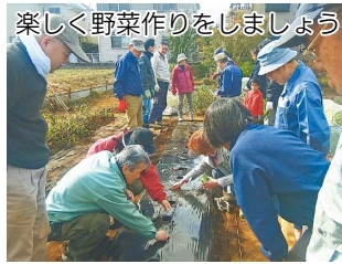
楽しく野菜作りをしましょう

も とまち地域センター自主事業 ま ち歩き・座談会 国 分寺の湧水と養蚕 11月11日(月)午後2時～4時 もとまち地域センター※荒天中止 もともち地域センター周辺には史跡武蔵国分寺跡や歴史的建造物が多数存在しています。自然に触れるまち歩きや座談会