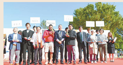
受賞店の皆さんおめでとうございます

市商工会が主催する国分寺お店大賞の受賞店が決まり、国分寺まつりで表彰式が行われました。投票いただきありがとうございました。