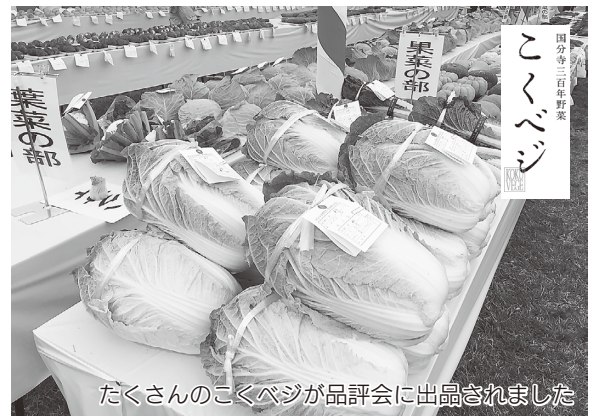
たくさんのこくベジが品評会に出品されました