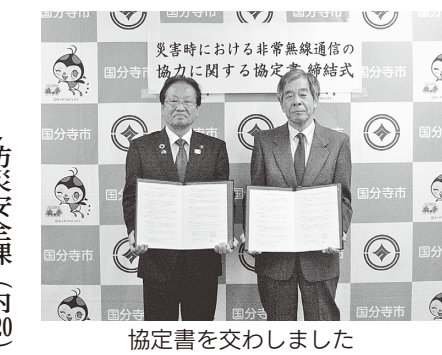
協定書を交わしました

災害協定を締結 11月14日に、災害時の非常無線通信の協力を得るため、国分寺市アマチュア無線クラブと災害発生時における非常無線通信の協力に関する協定書を締結しました。本協定で、災害時の非常無線通信に必要な機器を使用した被害状況等の情報収集・伝達体制が強化されました。