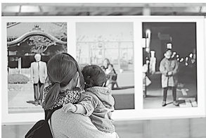
どこで撮った写真が分かるかな