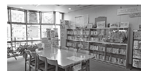
互いに情報を共有し 交流を深めましょう

男女平等推進センター(ライツこくぶんじ) →人権平和課☎(042)573-4378 男女平等社会の実現を目指して学習や活動を行っている団体の登録を受け付けています。登録団体には活動支援のため、施設の貸し出しを行っています。 ☎2月3日(月)〜3月13日(金) (土・日曜日、祝日を除く) 午前9時〜午後5時に直接人権平和課へ☎申請書配布人権平和課(ひかりプラザ内)