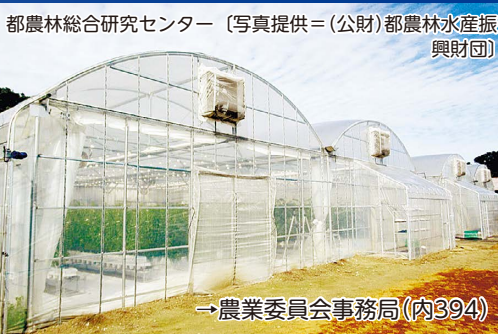
都農林総合研究センター

対市内在住・在勤・在学・在活で15歳以上の方(中学生除く)内都農林総合研究センター・都国立地方卸売市場(東京多摩青果)見学、昼食、農業者との意見交換会定30人¥1,500円※当日集金甲2月17日(月)から電話で農業委員会事務局へ※先着順催市農業委員会・市都市農政推進協議会・JA東京むさし国分寺地区注自動車での来場不可