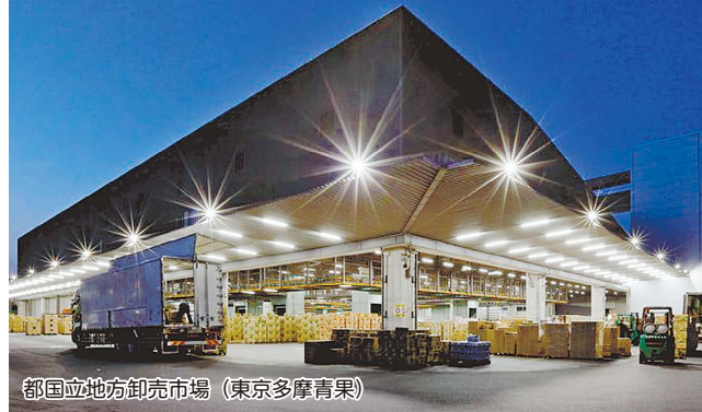
都国立地方卸売市場(東京多摩青果)

3月3日(火)午前9時~午後3時※雨天決行 JA東京むさし国分寺支店(集合・解散)