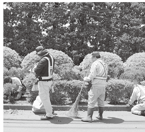
清掃作業をしています

加盟団体 (社福)万葉の里・(社福)けやきの杜・(社福)ななえの 里・(社福)はらからの家福祉会・(社福)東京聴覚障害者福祉 事業協会・(社福)Ann Bee・NPO法人Ohana・NPO法 人国障連喫茶・(一社)Life Commit・(一社)一粒福祉会・(社 福)市社会福祉協議会