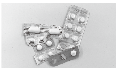
残薬を整理しましょう

処方されて飲み忘れたまま残っている薬(残薬)はありませんか。これらの薬を自己判断で使用すると、体の不調につながる場合があります。薬局で、残薬整理の相談に応じてもらえることがありますので、ご利用ください。