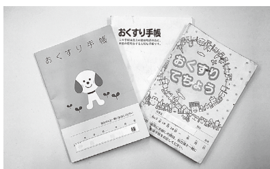
お薬手帳で自身の健康を管理しましょう

お薬手帳は、使用薬や過去のアレルギー・副作用・病歴、体調の変化などを記録するための手帳です。これらの情報を医療機関で確認してもらうことで、適切な対応を受けることができます。スマートフォンなどで活用できる電子版もあります。