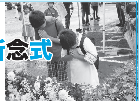
第30回平和祈念式での献花