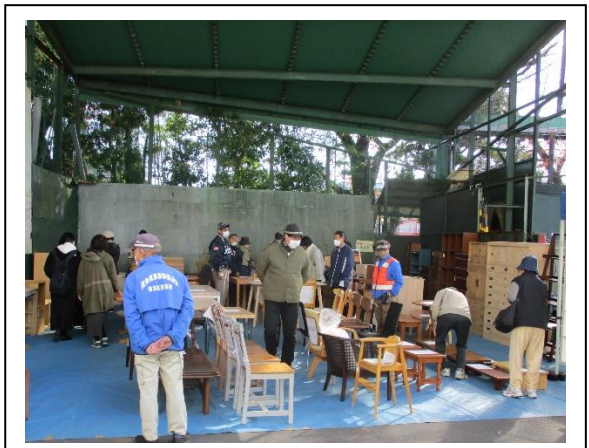
リサイクル家具販売会の様子

そのほか、環境に係るアンケートの実施、生ごみとせん定枝から作った「たい肥」の無料配布、フードドライブ等を実施しました。当日は、約300人の方に来場いただきました。