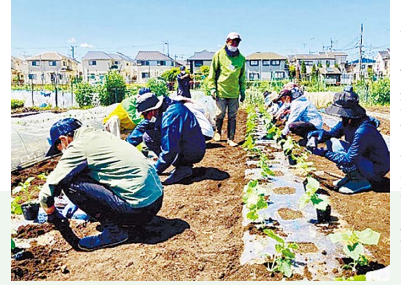
市民農業大学実習風景

受講期間4月1日(土)～12月中旬※毎週水・土・日曜日9:30(予定)から約2時間 実習地戸倉3-7-4※車での来校不可 申2月15日(水)までに往復はがき(消印有効)に市民農業大学受講希望・住所・氏名(ふりがな)・生年月日・電話番号、返信宛名を明記し、〒185-8501 経済課へ 注結果は3月下旬までに応募者全員に通知