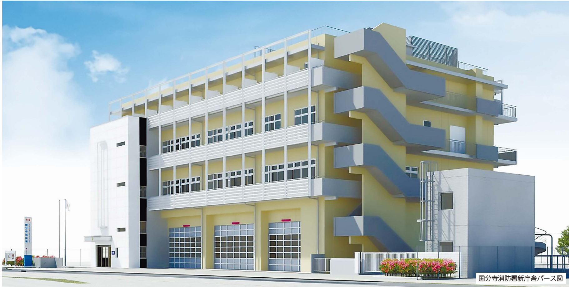
国分寺消防署新庁舎パース図

発行/国分寺市 編集/政策部市政戦略室 〒185-8501 東京都国分寺市戸倉1-6-1 ☎(042)325-0111 FAX(042)325-1380 市公式ホームページ(市HP)、市公式ツイッター、市公式フェイスブック、市モバイルサイトは、国分寺市 で検索 市長へのファクス☎(042)324-0906