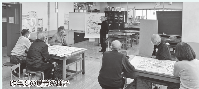
昨年度の講義の様子