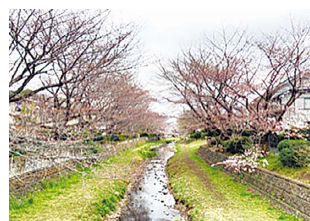
▲自然な状態に整備された小金井エリアの野川