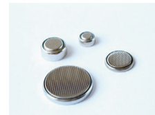
ボタン電池(取り出せないおもちゃ・腕時計なども含む)