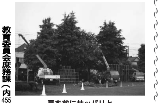
夏を前にサッパリと

「国分寺市造園組合」では、地域の緑化保全を願い、毎年社会奉仕活動を実施しています。今年5月20日、あいにくの雨の中でしたが、市立第六小学校の樹木の手入れを行いました。