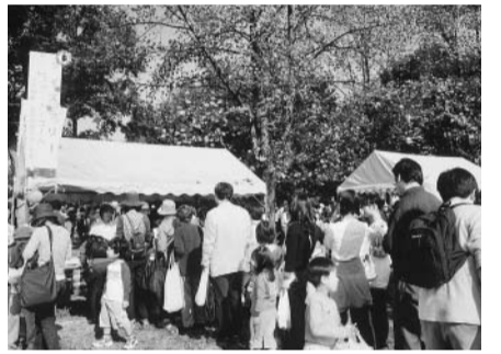
昨年の国分寺まつり

を理解し、通常の価格より割安にしてください。ゴミを持ち帰るごとのごみの団体 出店参加費 物品等販売の有無にかかわらず、出店者は次の参加費が必要です。参加費 5千円(1小間に付き) 電気料(使用する場合) 2千円 テントレンタル料(使用する場合) 1万5千円(設置・撤去含む) 参加費は、9月下旬(予定)の出店者会議時に納入してください