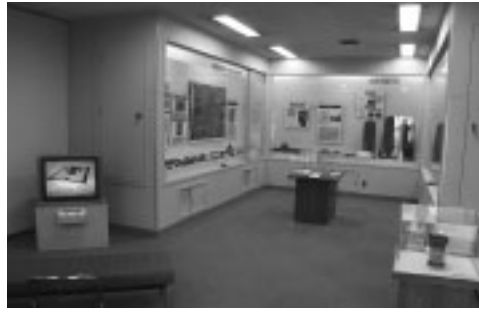
新装開室した展示室内

教育委員会では、市内遺跡から出土した埋蔵文化財を展示している国分寺市文化財資料展示室(西元町3-10-7市立4中内)を新装開室しました。今回は、武蔵国分寺跡出土の遺物を