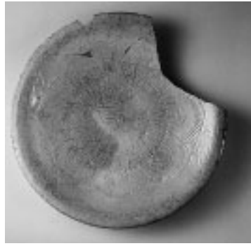
武蔵国分寺跡出土緑釉花文皿 【会場】文化財資料展示室(市立四中北) ※入場無料 ↓ふるさと文化財課(内479)

【日時】10月4日(火)～11月13日(日)午前10時～午後4時。月曜休館(当日が祝日の場合は翌日)