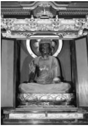
木造薬師如来坐像

国指定重要文化財「木造薬師如来坐像」の開帳(寺院の秘仏などを公開すること)に合わせて、市内文化財めぐりを行います。