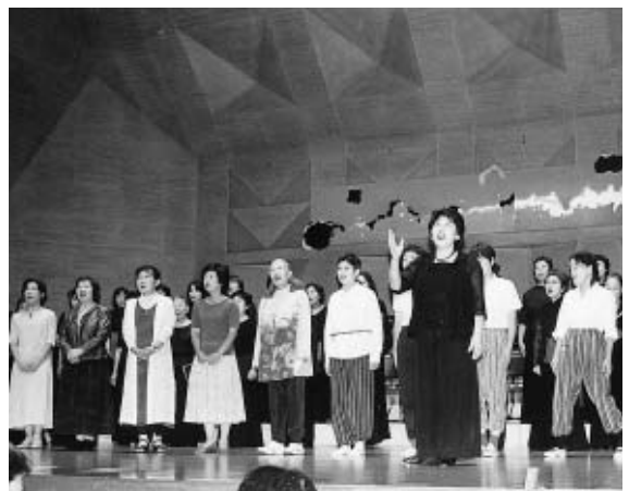
「平和への願い」子どもから大人へのメッセージ みんなの手で平和祈念行事開催 9月3日に市立いずみホールで、平和の担い手である子どもたちを中心に平和祈念行事を開催しました。広島市の平和祈念式に参加した小・中学生の子どもたち(ピースメッセンジャー)の広島報告や、四中生徒によるプラスバンド演奏、七小・八小の子どもたちの平和作品展など、来場した370人の皆さんと共に平和の輪を広げました。