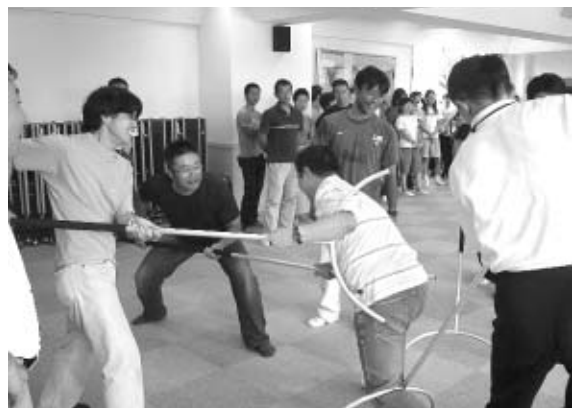
子どもたちの安全を守るために「学校110番」通報訓練とサスマタの研修 8月31日に第三中学校で、学校に不審者が侵入したことを想定して非常通報装置「学校110番」を活用しての訓練を実施しました。また、訓練の終了後、児童・生徒を不審者から守るために各校に配布してあるサスマタの活用法の研修会を小金井警察署防犯係の方々のご協力で行いました。この訓練には、市内の生活指導担当の先生方や近隣の幼稚園の先生方、保護者や地域の方々も参加し有意義な研修会になりました。