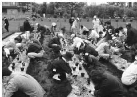
市民農業大学の苗植え

する契約上のトラブルや不当請 求等の市民からの相談や苦情に 適切に対処するため、相談窓口業 務を更に充実してまいります。 農業施策については、市民が 快適に暮らせる住環境を守るこ とを基本的な視点として都市農 業の特性を最大限に生かし、引 き続き市民農業大学(70)や援農ボ ランティア(71)事業の充実に努め ます。新たな交流型農業施策と して取り組んでまいりました体 験農園(72)は、その定着に努めて まいります。これからの農業振 興施策の充実に向け、昨年から