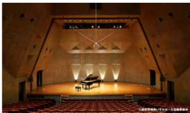
国分寺市立いづみホールAホール