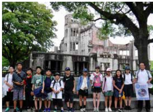
ピースメッセンジャー（原爆ドーム）