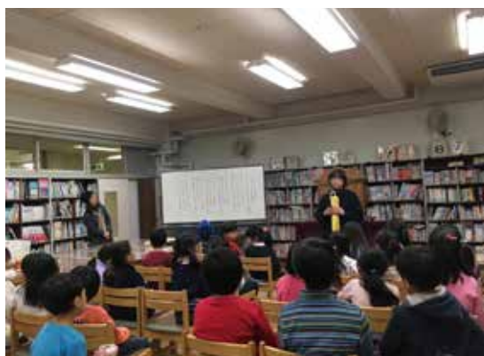
放課後子どもプラン