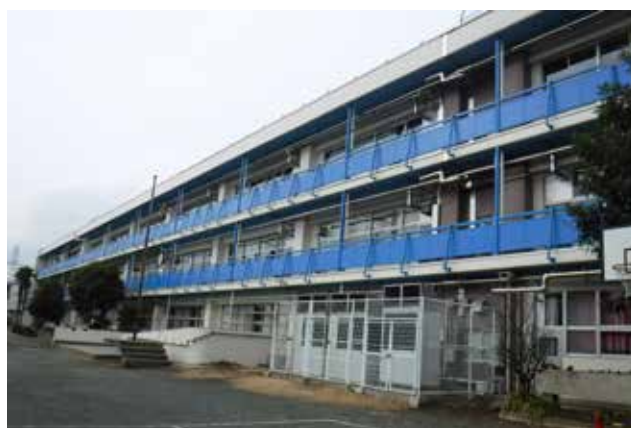
校舎大規模修繕（市立第六小学校）