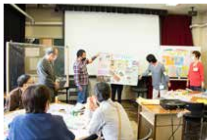
くめぎカレッジ ラボ