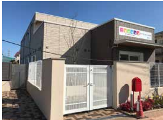
令和2年度整備保育園