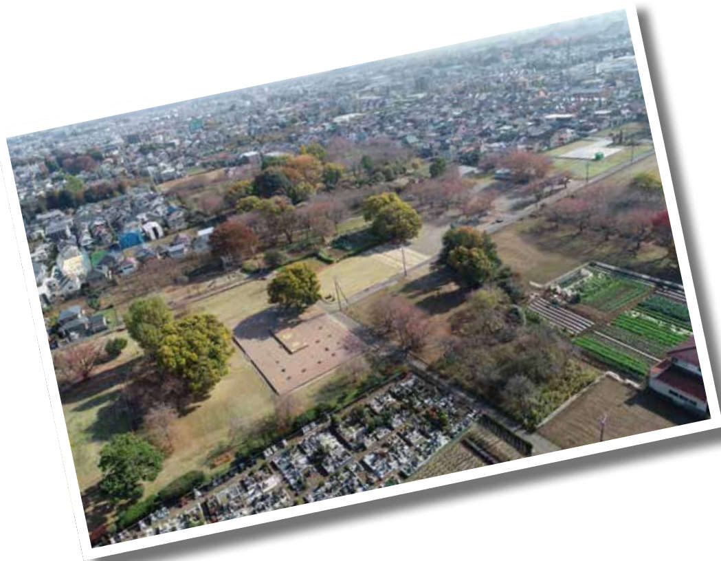
史跡武蔵国分寺跡