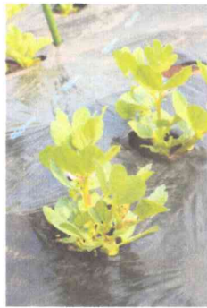
ソラマメの芽が出て順調に育っています。

昨年10月に苗を買って植えつけましたが、苗がとても小さく、ちゃんと大きくなるか心配です。マルチも強風で何度もはがれ、生育もイマイチ。6月頃、いったん掘り上げますが、おそらく玉が小さいので9月頃小さい玉をもう一度植えて年内収穫する予定。 (ホームタマネギ、セット栽培) 6～8月は苗づくりをしておいたズッキーニの苗を植えて短期間で栽培予定。