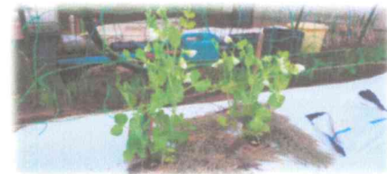
ニムラサラダスナップ