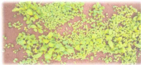
葉物野菜やんちやまき (コマツナ、ミズナ2種、リーフレタスなど)