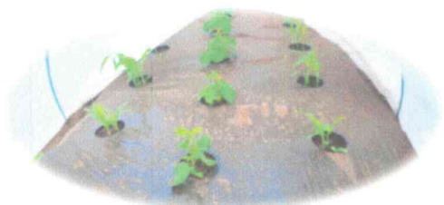
トウモロコシとエダマメの混植