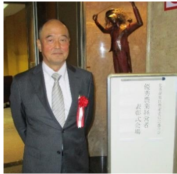
2月4日(火) 北多摩地区農業委員会連合会 優秀農業経営者表彰式