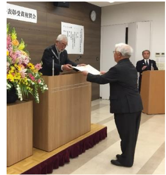
2月20日(木) 国分寺市優秀農業経営表彰 表彰式