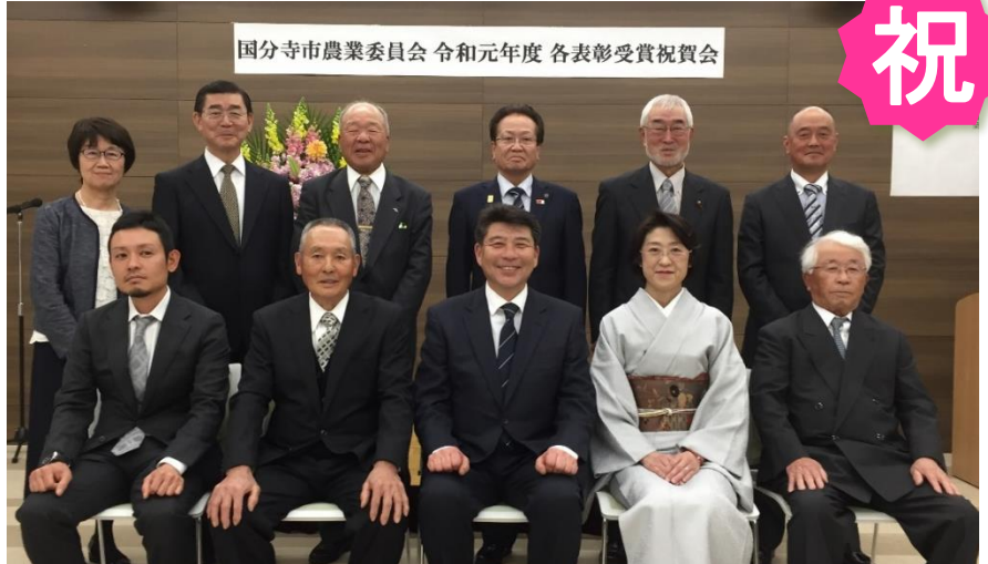
国分寺市農業委員会 令和元年度 各表彰受賞祝賀会