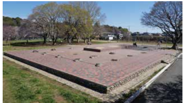
僧寺金堂跡整備基壇 南西から