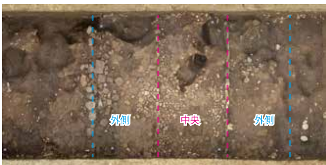
写真1 堂間通路(発掘調査時)