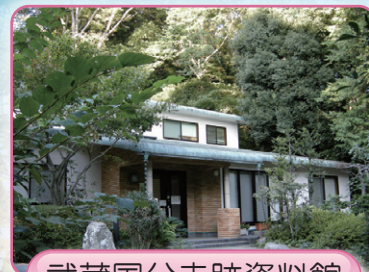
武蔵国分寺跡資料館