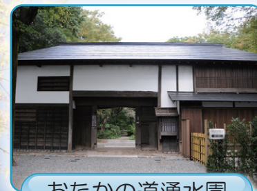
おたかの道湧水園