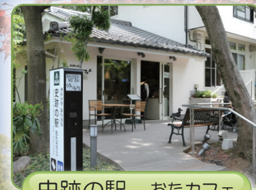
史跡の駅 おたカフェ