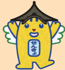
明るい選挙のイメージキャラクター ご当地「国分寺めいすいくん」

令和3年度は7月と10月に選挙があったね! 7月の東京都議会議員選挙、国分寺市長選挙、 10月の衆議院議員選挙の3つの選挙について、 ぼくと一緒に投票率などをみて振り返ろう! (※衆議院議員選挙は小選挙区の投票結果を載せているよ!)