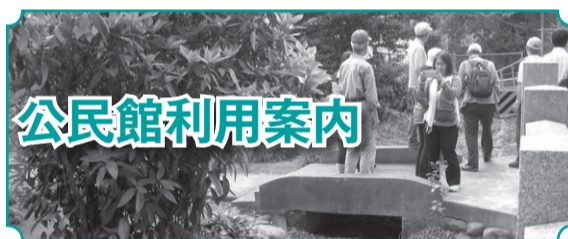
地域再発見ウォーク(並木)

公民館は、社会教育法に基づいた市民のための学習・文化活動を行う施設です。公民館では、①主催事業(講座・講演会・映画会など)の実施、②グループ活動や集会への会場提供、③自主活動のための印刷機・備品の貸し出し、などを通じて市民の学習要望に答えています。