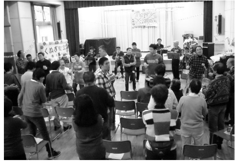
昨年のクリスマス会 (並木)