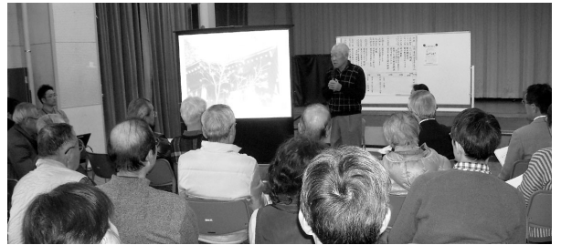
北部地域を知る事業 (並木)

並木の「地域のひろば-並木の会」は昨年4月から始まり、国分寺市の北部地域の人たちのつながりをひろげる活動を行っています。1月には、北部地域を知る事業を行いました。