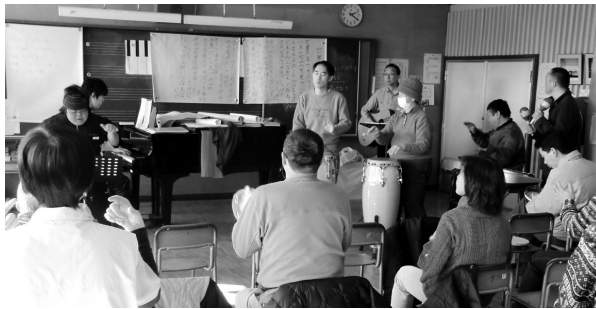
くぬぎ教室 (恋ヶ窪)

本多・並木を卒業し、恋ヶ窪に移る参加者のことを視野に入れた取組みもスタートさせました。