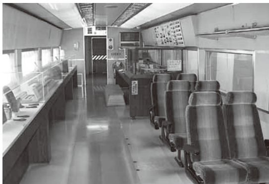
↑車内は新幹線発展の歴史を学べる資料館

1969(昭和44)年に試験車両として製造された951形新幹線は、現在ひかりプラザで新幹線資料館として使われています。 (国立駅北口から徒歩5分)