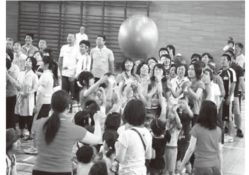
世代を越えて楽しむビーチボール送り