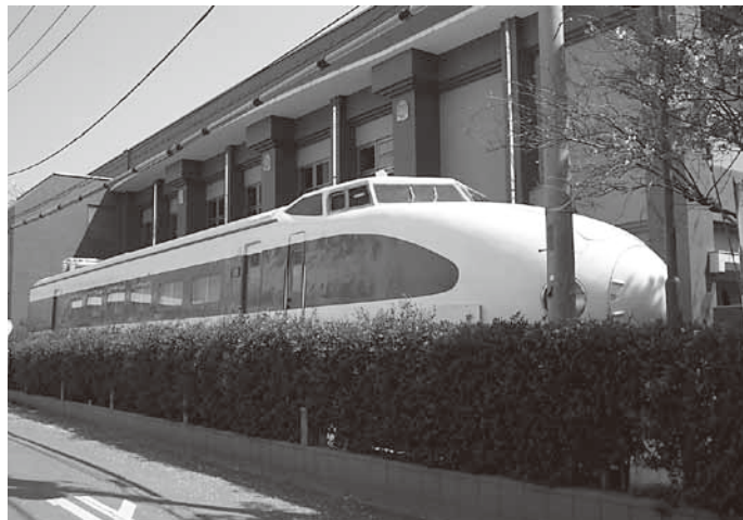
↑光町の名前の由来となった「ひかり号」

1969(昭和44)年に試験車両として製造された951形新幹線は、現在ひかりプラザで新幹線資料館として使われています。 (国立駅北口から徒歩5分)