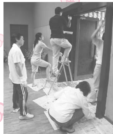
↑初級ペンキ塗り講習会(本多)