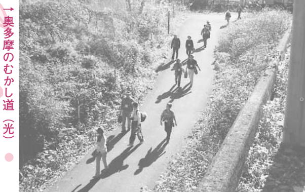
→奥多摩のむかし道(光)