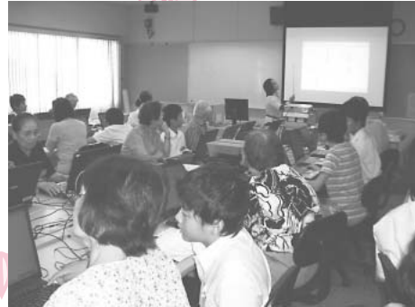
↑一中で開催のパソコン教室(恋ヶ窪)