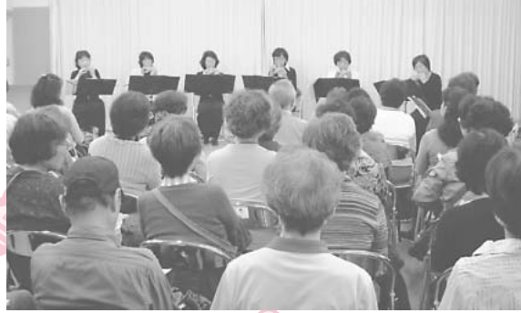
←ふれあいまつり(もとまち)