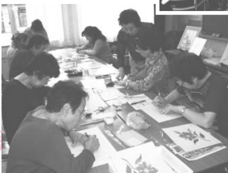
↑和紙ちぎり絵(恋ヶ窪)