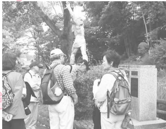
↑ふれあい散策 絹の道(もとまち)