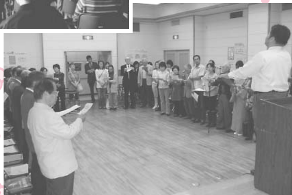
←光公民館まつり開会式(光)