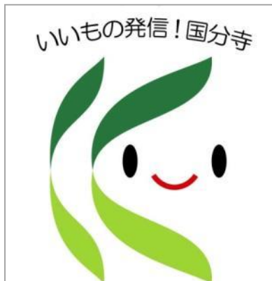
国分寺ブランド ロゴマーク