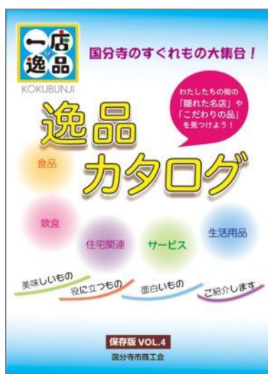
「逸品カタログ」(一店逸品事業)