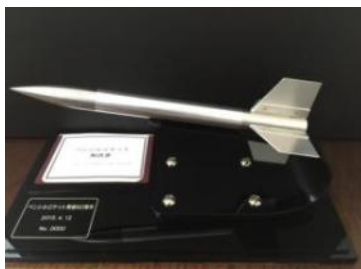
ペンシルロケットレプリカ

昭和30年、国分寺市本町一丁目(現・早稲田実業学校敷地内)にて全長23cmのペンシルロケットの水平発射実験が日本で初めて行われました。実験から50周年を迎えたことを機として、平成18年には、早稲田実業学校校門に「日本の宇宙開発発祥の地」顕彰記念碑が建てられました。