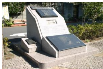
「日本の宇宙開発発祥の地」 顕彰記念碑