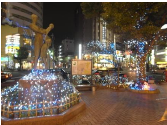
国分寺駅南口イルミネーション

市内各駅周辺や商店街を中心とした歩行環境を整備することで、ぶらぶら歩きを楽しめるまちを目指します。具体的には装飾街路灯のLED化がほぼ完了したため、今後発生してくるLEDの更新に対する支援に取り組むとともに、まちづくりと連動した取組についても検討します。