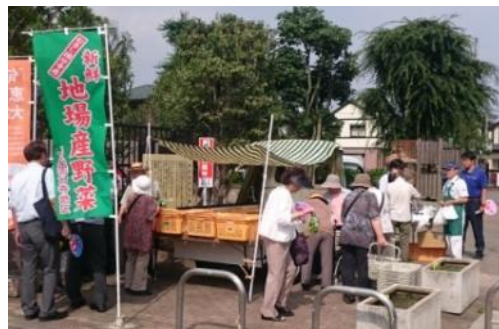
公園での市内農産物の販売

市内で実施されているイベントを通じ、地元を楽しむ地元で買い物をする市民を増加させることで、バイ・ローカルの意識を育て上げます。特に商工会やJA、観光協会と連携を図り、「ぶんじふれあい市」やマルシェ等を、国分寺駅北口交通広場等を有効活用し定期的に開催することで、市民が地元へ愛着を感じ将来に渡って地元で買い物をする意識の醸成を図ります。