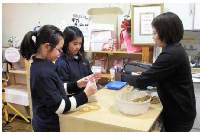
商店街イベント「ぶんザニア」の様子

* ぶんザニアでは、子どもたちが実在店舗や、警察署、消防署等にて仕事体験ができます。同イベントは、第12回東京商店街グランプリ(平成28年度)にて準グランプリを受賞しています。