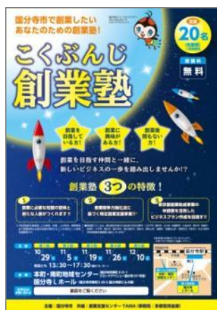
こくぶんじ創業塾チラシ

これまで、産業競争力強化法に基づく創業支援等事業計画の下、定期的な個別相談会やセミナー、創業塾を実施してきました。事業の周知活動に力を入れたことにより、多数の創業希望者が参加し、市内での創業につながりました。今後も市内での創業者が増えるような新たなセミナーなどを関係機関と連携して実施するとともに、商工会や商店会への加入促進にもつながるような効果的な手法も検討していきます。