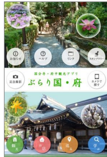
「ぶらり国・府」トップ画面

同協議会が開発したスマートフォン・アプリ「ぶらり国・府」では、国分寺市と府中市の歴史・文化・自然等の観光スポットを楽しく案内するほか、お店やイベントの情報も発信しています。