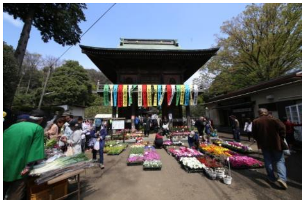
「国分寺物産展」 平成27年度写真コンクール JA東京むさし賞