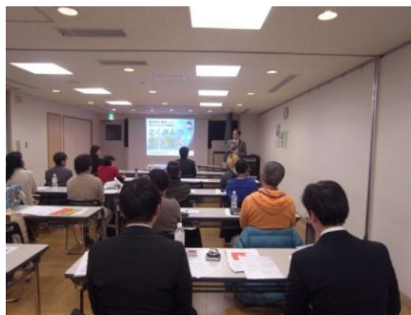
こくぶんじ創業塾の様子