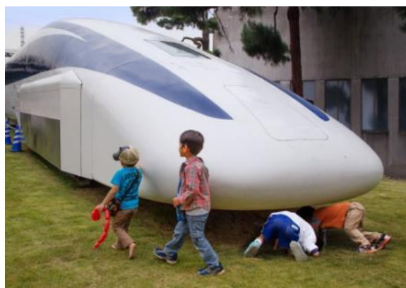
「リニアカー 浮いているかな！」 平成27年度写真コンクール 観光協会長賞