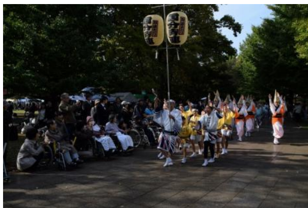
「観覧」 平成27年度写真コンクール 商工会長賞