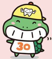
「カメ（噛め）ちゃん」噛ミング30（サンマル）食育推進キャラクター