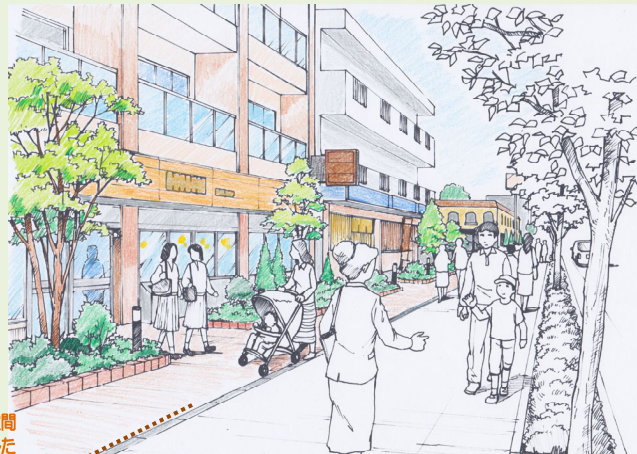
壁面後退により前面空間を創出して緑を配置した場合のイメージ

緑豊かな本エリアの特性を将来も維持するため、民有空間及び公共空間の緑化を進めるとともに、市の貴重な歴史資源である史跡との調和を図り、住みやすい住宅環境のまちを目指します。