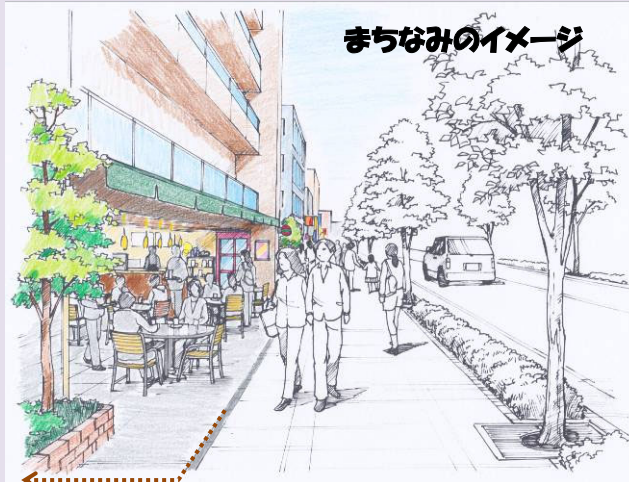
壁面後退によるオープンスペースを創出した場合のイメージ

中高層建築物の立地を誘導し、特に、駅に近い北側のエリアでは、低層階に店舗等があり学生や住民が集い楽しむことのできるまちを目指します。