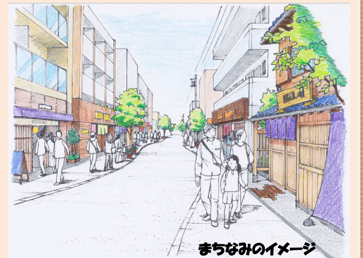
まちなみのイメージ

また、駅に近いエリアを中心に、建築物の低層階に店舗等が続き、人が集まり、人を呼ぶ、にぎわいのあるまちを目指します。