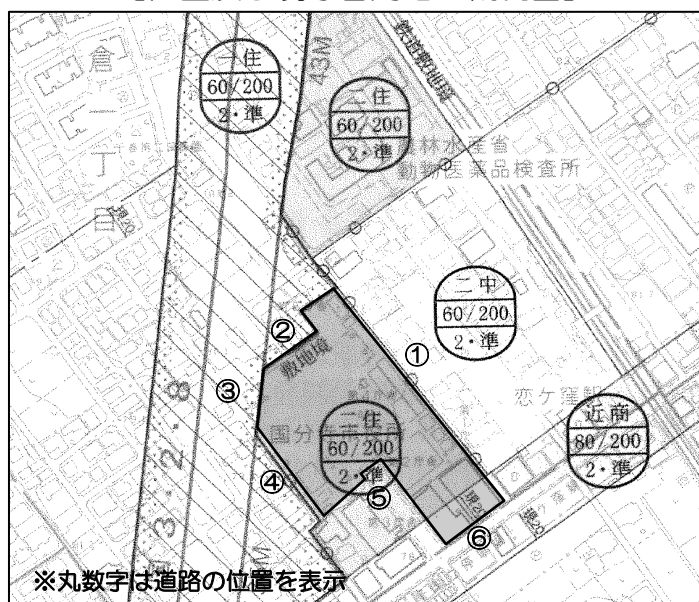
【位置及び現庁舎用地の概況図】